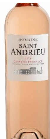
Un rosé fin et fruité.

Prix moyen 12,50 €, en vente au domaine, tél. 04.94.59.52.42.