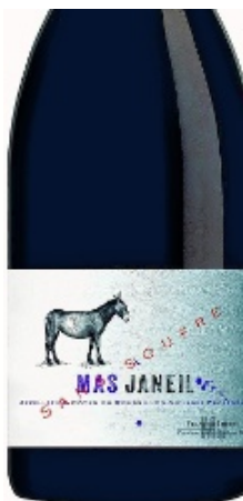
Un vin aromatique.

Les Domaines François Lurton proposent la cuvée Mas Janeil Rouge sans soufre AOP Côtes du Roussillon-Villages. Issu d'un assemblage de grenache noir 28,5 %, mourvèdre 28,5 %, carignan 21,5 %, et syrah 21,5 %, ce vin se distingue par un nez aromatique, très frais, dominé par les fruits rouges (cassis, mûre sauvage). Des notes d'épices douces et de violette se détachent. L'attaque en bouche est suave, grasse, sans agressivité, gage d'une belle maturité des fruits. Les tanins sont bien présents mais la structure ne domine pas le fruit. Un vin précis, d'une belle fraîcheur qui éclate en bouche.