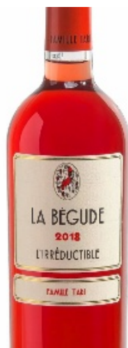
Un excellent Bandol.

Prix moyen 26 €, certifié ECOCERT, en vente au domaine, tél. 04.42.08.92.34