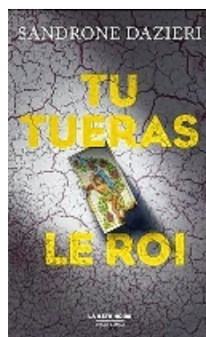
Une conclusion magistrale.

Voilà quinze mois que Dante Torre, l'Homme du Silo, a été enlevé. Quinze mois que Colomba Caselli vit retirée