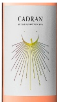
Un rosé frais et vif.

Prix moyen 9 €, en vente à la propriété, tél. 05.53.24.18.43. Certifié Ecocert.