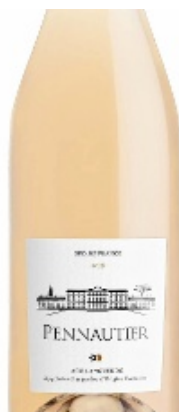
Fruité et croquant.

Prix moyen 8 € En vente chez les cavistes indépendants.